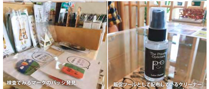
検査でみるマークのバッジ発見。